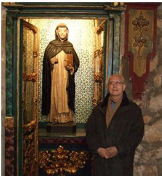
El P.Gago en la Cueva de Sto. Domingo tras su restauración

Es una pequeña dependencia que presta su servicio al culto religioso y como salita de reuniones de grupos.