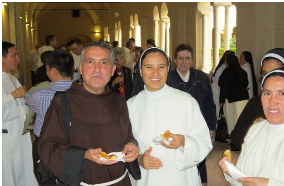
(25 de mayo de 2013)