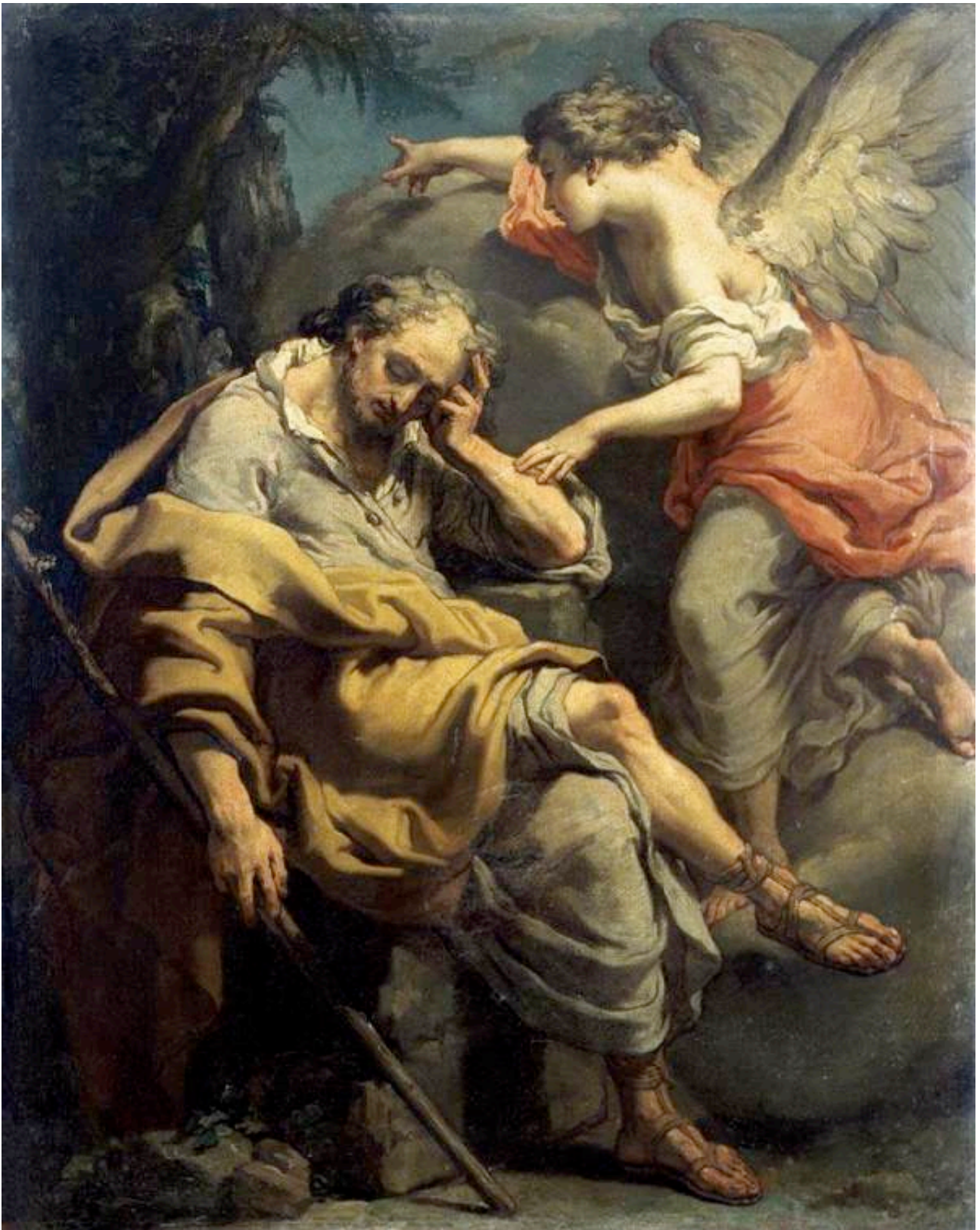
Gaetano Gandolfi, El sueño de san José