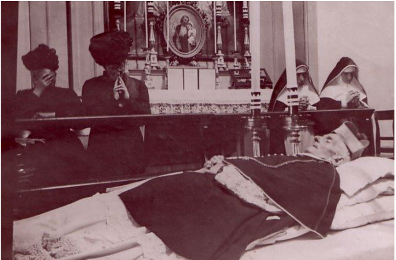
La Postulación general, O.P.

Fundó una congregación de dominicas dedicadas al Espíritu Santo para la formación de las niñas y jóvenes (1872). Dos años más tarde, en 1874, fue nombrado Obispo coadjutor del de San Miniato. En 1897 se convirtió en Obispo residencial de aquella misma diócesis. Fue amado por su entrega a la formación del clero y de los jóvenes y por su solicitud caritativa para con todos. Por motivo de enfermedad renunció a la diócesis en 1907 y San Pío X le nombró Arzobispo titular de Sárdica. Murió en Florencia el 15 de agosto de 1912 con fama de santidad. El 9 de octubre de 2013 el Papa Francisco reconoció sus virtudes heroicas.